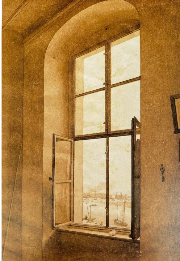
Blick aus dem Atelier des Künstlers, linkes Fenster