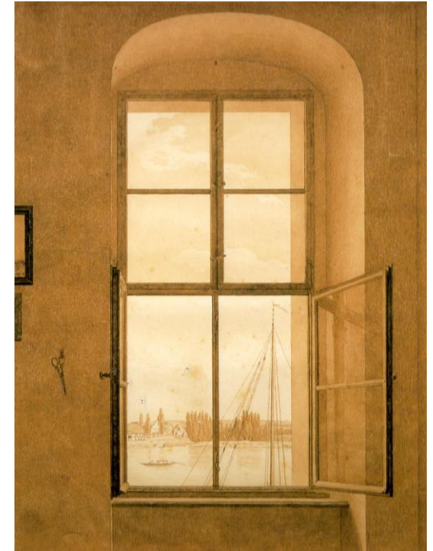
Blick aus dem Atelier des Künstlers, rechtes Fenster